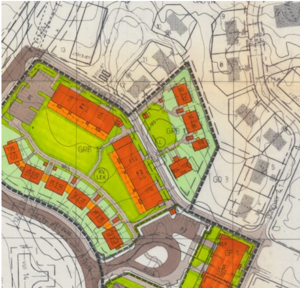
Utsnitt av bebyggelsesplan fra 1988